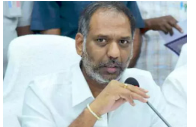
తీసుకుంటున్నామని చెప్పారు. మహిళలకు దేశంలోనే అత్యంత సురక్షిత నగరంగా విశాఖ నిలవడం గర్వకారణమన్నారు.

మరోవైపు ఒంగోలులో నిర్వహించిన మహిళా దినోత్సవ కార్యక్రమంలో మంత్రి డీఎస్బీపీ స్వామి పాల్గొన్నారు. మహిళా సాధికారత, సంక్షేమానికి ప్రభుత్వం పెద్దపీట వేస్తోందన్నారు. మహిళలపై నేరాలకు పాల్పడే వారిపై కఠిన చర్యలు